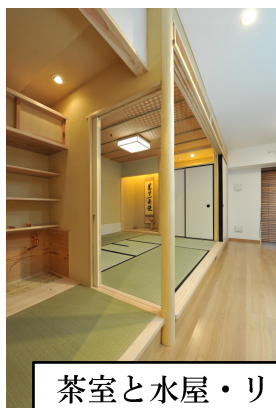
茶室と水屋・リビングの関係