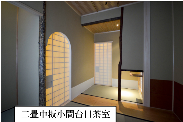
二畳中板小間台目茶室