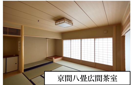
京間八畳広間茶室

稲村ガ崎の高台住宅から遠くに江ノ島を眺めながら、茶室でお茶を楽しむことができる環境の中に、広間と小間を新設しました