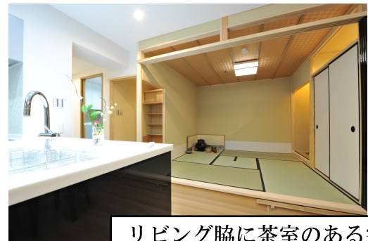
リビング脇に茶室のある空間！

マンションのリビングの脇に開放感がありかつ茶の出来る四畳半和室スペースを造作しました。普段は襖を外して、リビングと一体になったくつろぎ空間となり、茶道だけでなく、生活の中でのリラックス空間としてご活用いただいております。